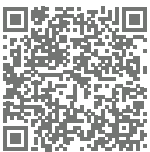
Link zum Video